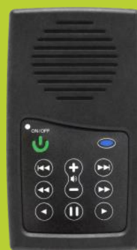
Tigrinisch Luister NT